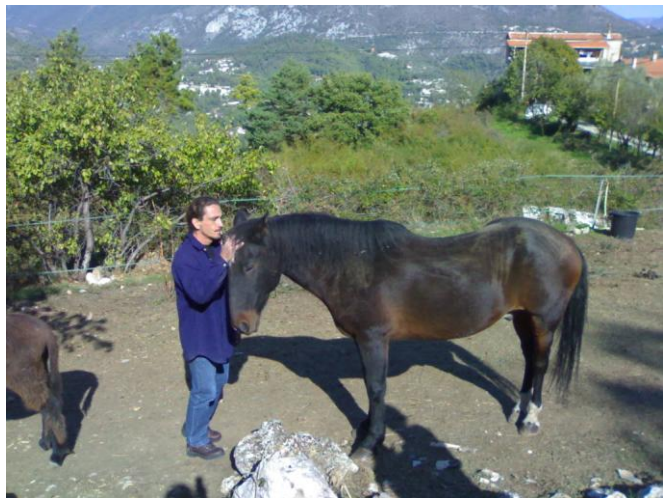
Tu as voulu des Gros Câlin Papi t'en a fait plein.