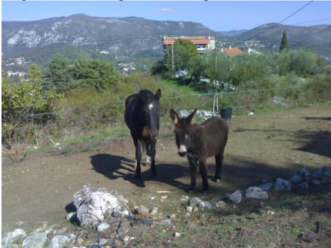
Domino et son nouveau Copain Bébé Ane de 6mois.