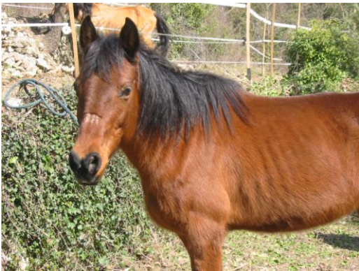
Lilli à son arrivée chez nous

Nous avons rencontré la responsable qui nous a expliqué tous les problèmes qu'elle rencontrait. Nous avons alors décidé de récupérer dans un premier temps les 2 juments les plus en danger car ne pouvant plus travailler, elles étaient plus que sous alimentées !