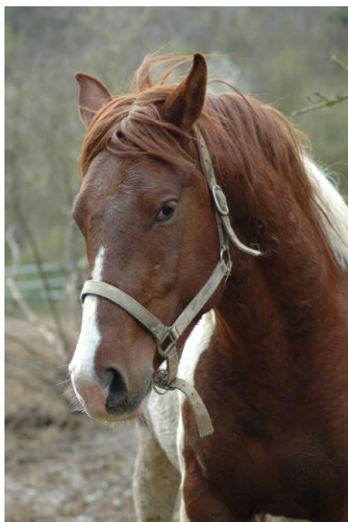
« Padre L'entier »